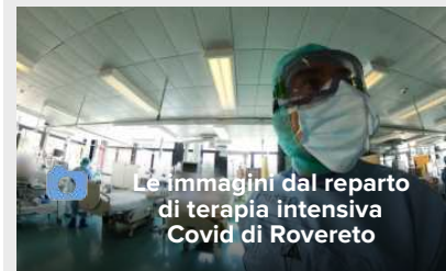
Le immagini dal reparto di terapia intensiva Covid di Rovereto