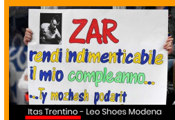
Itas Trentino - Leo Shoes Modena