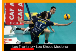
Itas Trentino - Leo Shoes Modena